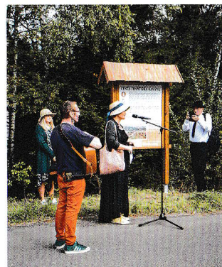
Slavnostní otevření 10.9.2022

Hlinsko a široké okolí je kraj, který je s Františkem Kavánem a jeho dílem nerozlučně spjat. Na této stezce je umístěno 6 informačních panelů s Kavánovými obrazy , a to vždy v místě, ze kterého je dobrý výhled na scenérii zachycenou na obraze. Vyobrazená díla jsou přes sto let stará a krajina se za tu dobu samozřejmě hodně změnila, ale i takový zážitek je jistě pro návštěvníky zajímavý. Mohou si porovnat pohled, který viděl mistr Kaván, s pohledem, který se dnes naskytá jim. Informační tabule zároveň návštěvníkům poskytují i vhled do Kavánových myšlenek a pocitů z té doby, protože přináší také úryvky z jeho vlastní autobiografické zповědi, kde se vyznává z lásky k tomuto kraji, jehož drsný ráz zažíval na vlastní kůži a leckdy z něho utíkal, aby se sem zase plný stesku vracel.